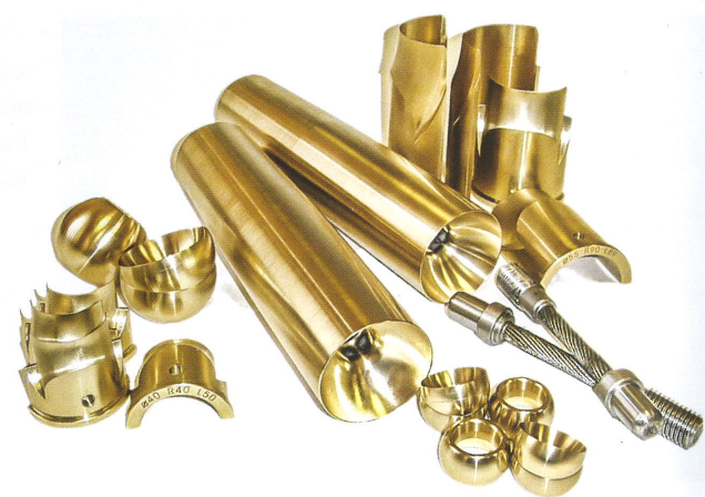
Narzędzia do gięcia rur

- O ile sama firma WRAZIDŁO została założona w 1989 roku, to jednak nasza działalność bazuje na rodzinnej tradycji inżynierskiej, ciągnącej się już od 4 pokoleń. W związku z tym decyzja o założeniu niezależnej działalności po przemianach ustrojowych była raczej oczywista, tym bardziej, iż na naszym terenie było stałe zapotrzebowanie na usługi ślusarsko-obróbcze z zakładów górniczych, co od samego początku gwarantowało nam dostęp do dobrze funkcjonującego rynku zbytu.