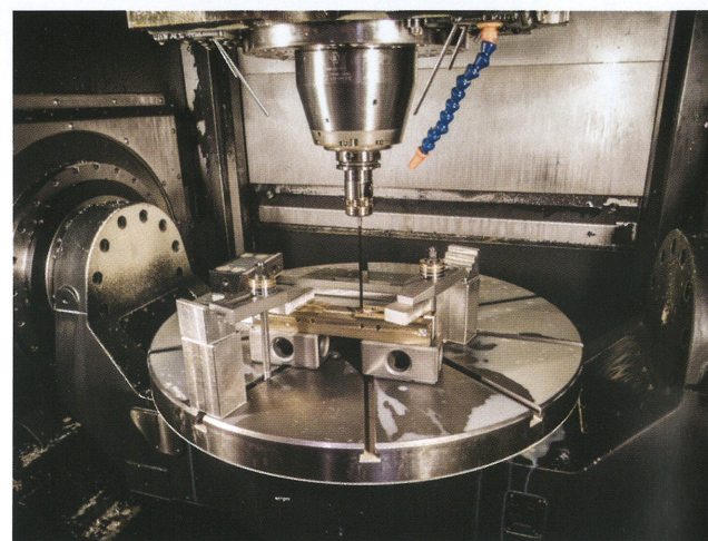
Obróbka detalu na 5-osiowym centrum frezarskim firmy KOVOSVIT MAS

W ubiegłym roku obchodziliście 30-tą rocznicę istnienia. Działalność gospodarczą rozpoczęliście w okresie, kiedy w Polsce zaczęły się wielkie przemiany społeczno-gospodarcze. Proszę powiedzieć, jakie były początki funkcjonowania firmy i z jakimi trudnościami musieliście się wtedy zmierzyć?