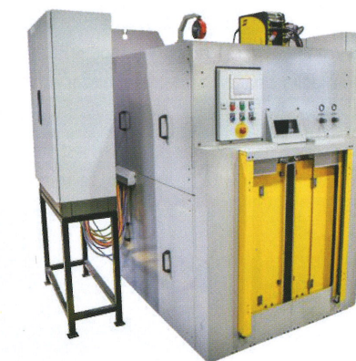
Maszyna do spawania liniowego ELEFANT