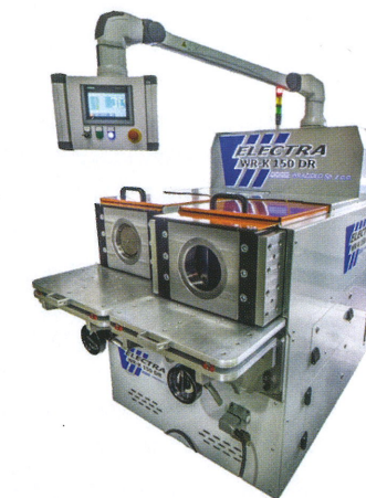
Kalibrownica elektryczna ELECTRA WR-K 150DR

- Maszyny, którym aktualnie poświęcamy najwięcej uwagi, to linia w pełni elektrycznych kalibrownic ELECTRA WR-K. Widząc braki i wady kalibrownic hydraulicznych będących obecnie na rynku, postanowiliśmy zaprojektować od zera własne rozwiązanie, które będzie odznaczało się wyższą precyzją pracy, niższym hałasem i lepszą energooszczędnością. Maszynę wyposażyliśmy w szereg innowacyjnych modułów rozszerzeń, m. in. w narzędzia, moduł do fazowania, czy też integrację z ramieniem robota, dzięki czemu weszliśmy na rynek z produktem diametralnie wychodzącym przed szereg w porównaniu z ofertą konkurencji. Pierwsze egzemplarze maszyn ELECTRA WR-K z powodzeniem pracują już w firmach sektora samochodowego, a dzięki swojej precyzji – także lotniczego.